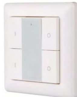
021369 Knob SR-KN9550K4-UP