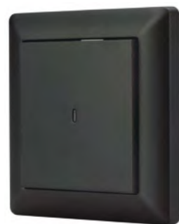
023847 Knob SR-KN0120-IN