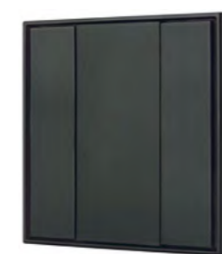
028757 KNX-223-2-BLACK (BUS)