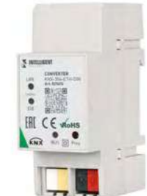
025676 Конвертер KNX-304-ETH-DIN (BUS)