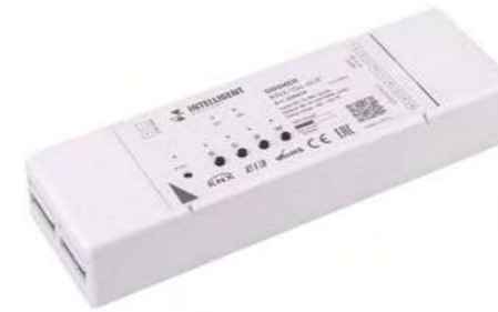
025659 Диммер KNX-104-SUF