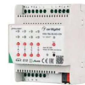
025671 Контроллер штор KNX-704-BLIND-DIN