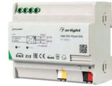
025542 Блок питания шины KNX-902-PS640-DIN