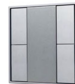
028720 KNX-223-4-GREY (BUS)