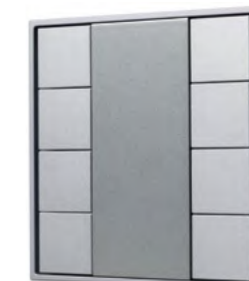
027962 KNX-223-8-GREY (BUS)