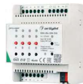
025660 Диммер KNX-204-DIM-DIN